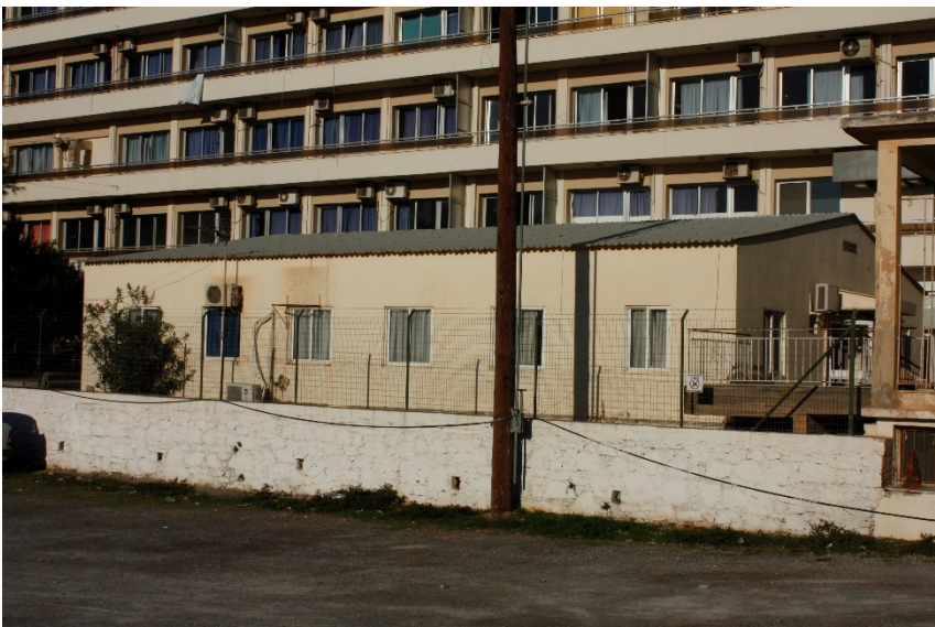
εικ. 2: Το κτίριο της Αιμοδοσίας από την ανατολική πλευρά.