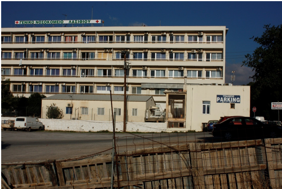
εικ.3: Ανατολική όψη Γ.Ν.Α.Ν. με τα κτίρια της Αιμοδοσίας και της Τεχνικής Υπηρεσίας στο ανατολικό όριο του ακαλύπτου χώρου του συγκροτήματος. (Τα κτίρια χρήζουν άμεσα και εξωτερικής συντήρησης).