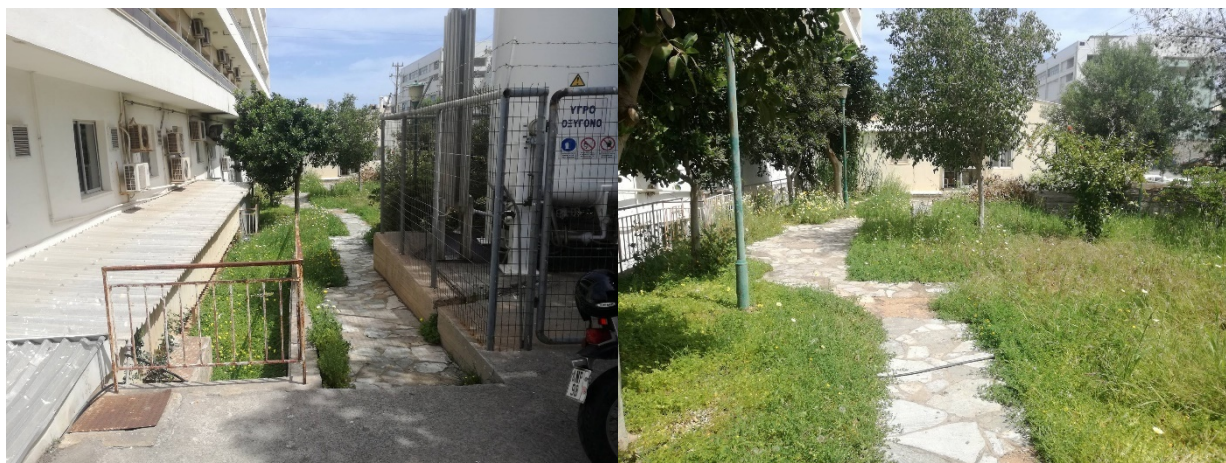
εικ.6,7: Πρόσβαση κτιρίου Αιμοδοσίας σήμερα από τη νότια πλευρά (είσοδος οδού Κνωσού). Λειτουργικά και πρακτικά προβλήματα πρόσβασης που είναι δυσχερής ακόμη και για τους πεζούς.