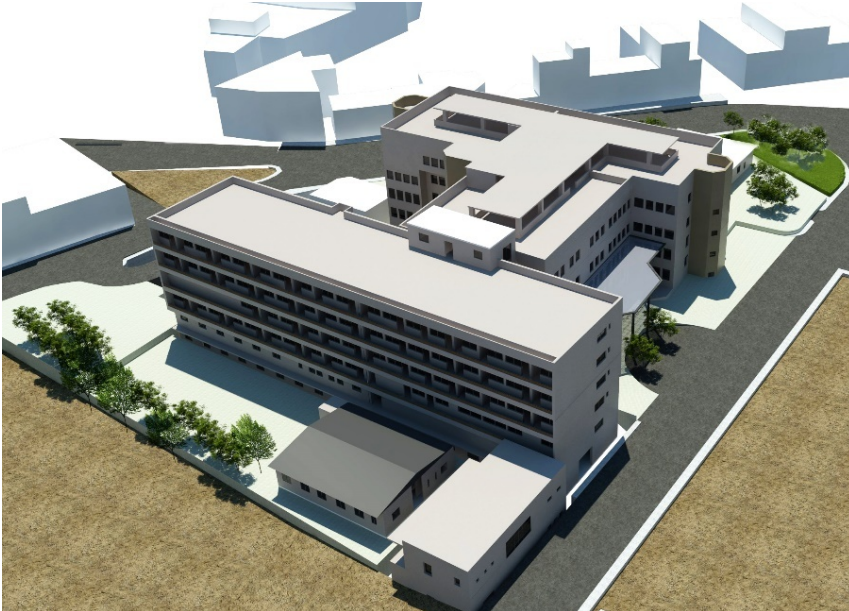
εικ. 1: Φωτορεαλιστικό του Γ.Ν.Α.Ν. με τη θέση της κτιριακής Μονάδας με τη δικλινή στέγη που θα στεγάσει τη ΜΤΝ, στον ακάλυπτο χώρο της ανατολικής πλευράς (κάτω μέρος της εικόνας)