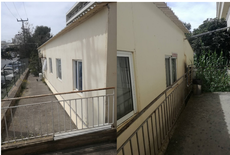
εικ. 4,5: Ανατολική και δυτική όψη κτιρίου Αιμοδοσίας. Διακρίνεται η ράμπα σύνδεσης με το κεντρικό κτίριο που χρήζει βελτιώσεων, ιδιαίτερα στην κλίση που διαθέτει.